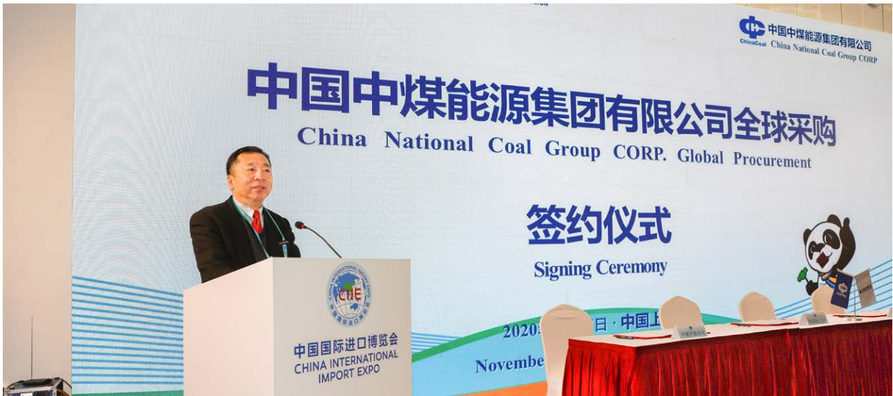
中煤能源参与第三届中国国际进口博览会

个方面的具体工作措施。加强总法律顾问制度建设，公司所属重要子企业全部建立了总法律顾问制度，为企业合规经营提供了有力支撑。