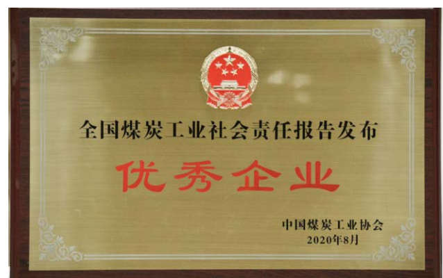
“全国煤炭工业社会责任报告发布优秀企业”奖牌

加强社会责任沟通。 从2009年发布第一份社会责任报告起，中煤能源至今已连续12年发布社会责任报告，两次获得“央视财经50指数·十佳社会责任公司”荣誉。2020年，中煤能源、上海能源荣获“全国煤炭工业社会责任报告发布优秀企业”荣誉。