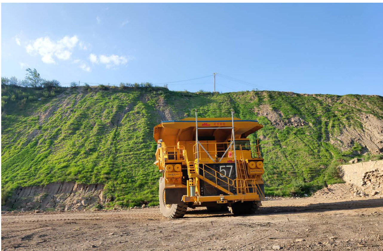
中煤平朔露天矿首台无人驾驶卡车测试成功

煤矿智能化建设成效突出。制定印发煤矿智能化建设指导意见，加大技术攻关与工程实践力度，提升中煤特色智能化关键