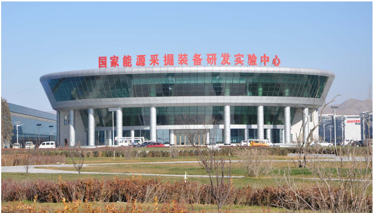
国家能源采掘装备研发实验中心

公司不断构建开放合作创新模式，分别与中国煤炭科工集团、中国矿业大学（北京）、安徽理工大学、武汉理工大学等一流高等院校和研究机构签订开展高层次合作协议，建立全面战略合作伙伴关系；加入了“煤矿智能化技术创新联盟”、“中国矿业知识产权联盟”。